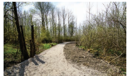
Das Rohplanum für den Auenerlebnisweg ist hergestellt, 2019 folgt das Feinplanum.