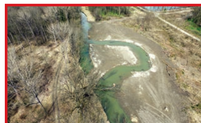
Wo vorher ein Fichtenforst stand, darf jetzt der Reitbach frei fließen. Eine neue Bachschlinge wurde angelegt.