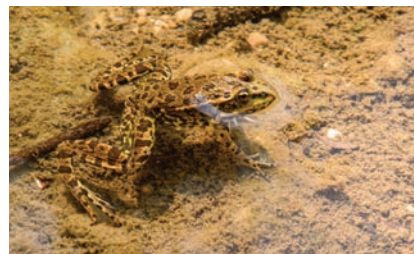
Wasserfrösche haben die neuen Lebensräume bereits besiedelt.

Aus der Vogelperspektive ist die neue, gebuchtete Uferzone des Auses besonders gut zu erkennen.