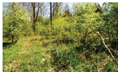
Die Fichten wurden entnommen, das Laubholz soweit möglich erhalten.

Im Sommer werden Pflegemaßnahmen umgesetzt, um Neophyten wie das Springkraut auf den Renaturierungsflächen in Schach zu halten und das Aufkommen heimischer Arten zu fördern. Ab Herbst erfolgen Restarbeiten am Ausee, die im vergangenen Winter wegen der feuchten und milden Witterung nicht möglich waren. Gleichzeitig wird weiter an der Besucherinfrastruktur gearbeitet. 2019 ist die Eröffnung des Auenerlebniswegs mit Vogelbeobachtungsplattform („Hide“) und Steg über den Reitbach geplant.