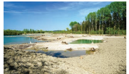
Sand und Schotter von den Absenkungsflächen am Reitbach (oben) wurden am Ausee für die Herstellung flacher Uferzonen (unten) verwendet.