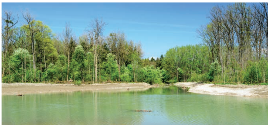
Im Norden der Weitwörther Au entstand dieser neue Nebenarm des Reitbachs.